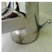
Mit Warmwasser abspülen