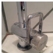
Reinigungsmittel pH-Wert <6,5 und >7,5